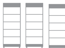
3 x HVS 12.8